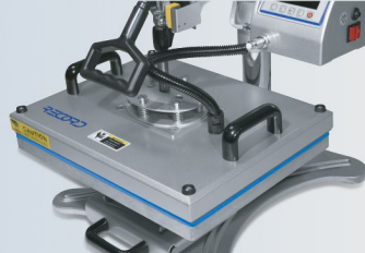
کلمپ تی شرت